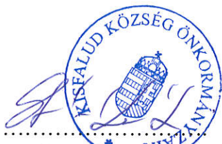
Szabó-Kovács Szabina polgármester